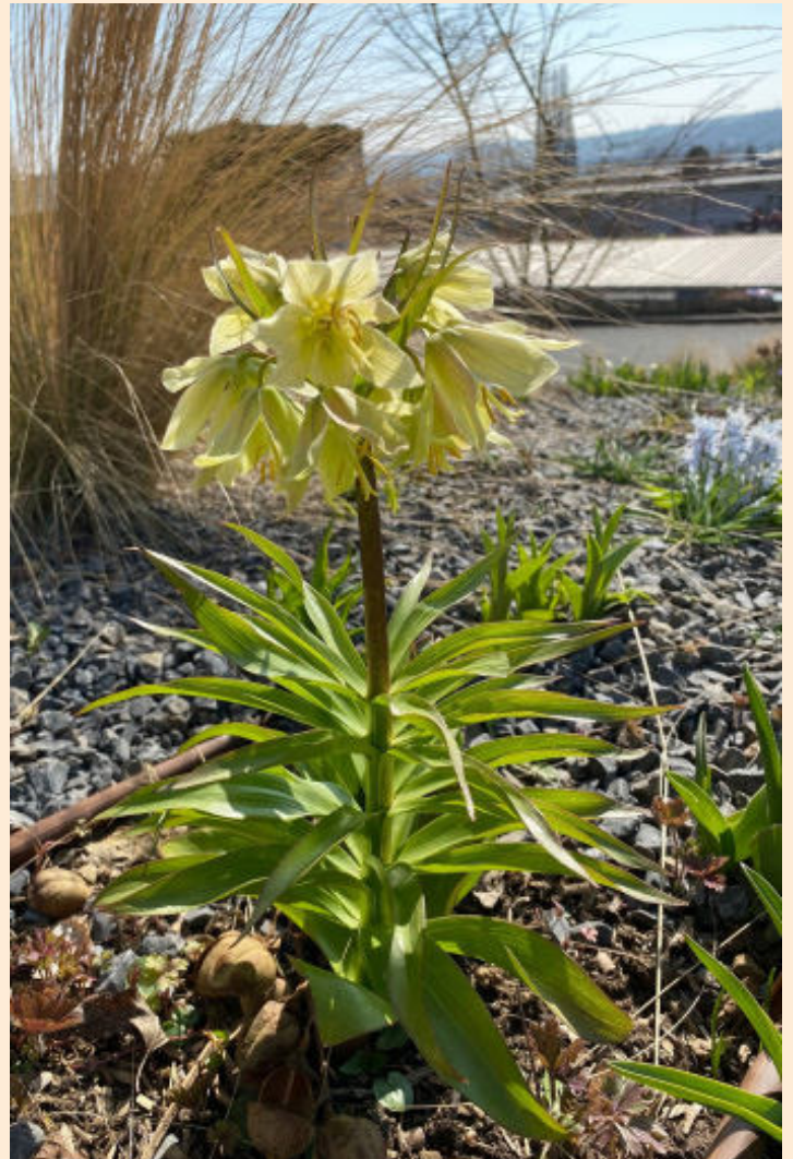
Sanfte Schönheit: Die anmutige Zwerg-Kaiserkrone ( Fritillaria raddeana ) passt gut zu naturnahen Gestaltungen.