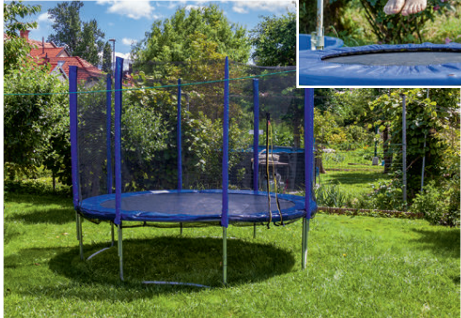
Beim Thema „Trampoline“ gehen die Meinungen auseinander ...

Im Handel werden Trampoline mit einem Durchmesser von 1,20 m bis 5 m angeboten. Je größer die Geräte sind, desto komplexer ist die Verankerung mit