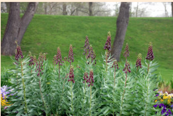
Bildhübsch: In kleinen Tuffs gepflanzt kommt die Persische Kaiserkrone ( Fritillaria persica ) besonders gut zur Geltung.